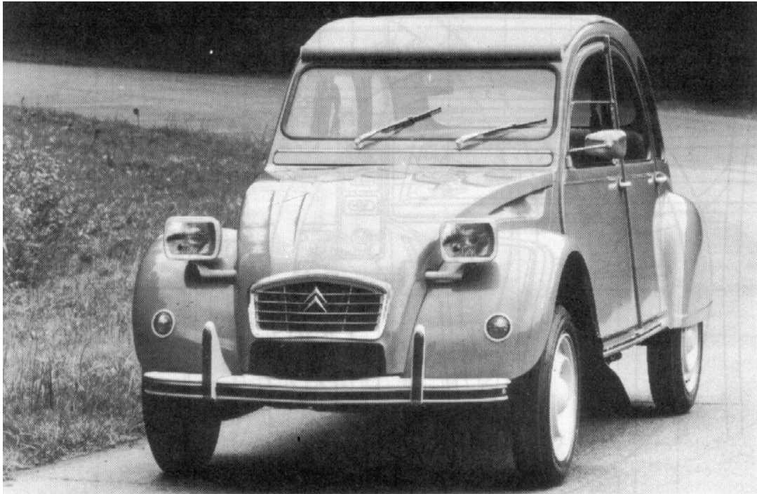
Figuur 1: De 2CV6 club '81